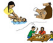
Figura # 11