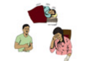
Figura # 1

¿Qué enfermedades ha padecido la familia? Pida a los miembros de la familia que describan brevemente alguna enfermedad que recuerden.