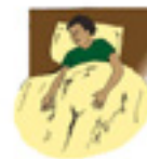
Figura # 2