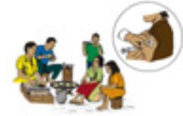
Figura # 9

Pregunte si alguien recuerda una epidemia ¿cuál enfermedad era y qué pasó?